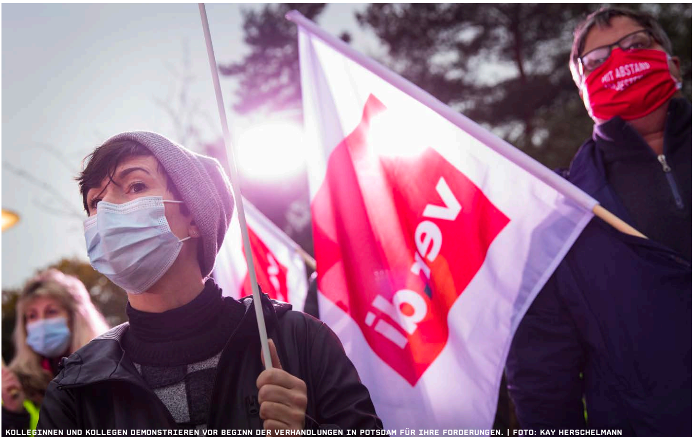
KOLLEGINNEN UND KOLLEGEN DEMONSTRIEREN VOR BEGINN DER VERHANDLUNGEN IN POTSDAM FÜR IHRE FORDERUNGEN.

Auch nach der zweiten Verhandlungsrunde in der Tarif- und Besoldungsrunde für die Beschäftigten der Länder ist eine Einigung in weiter Ferne. Die Tarifgemeinschaft deutscher Länder (TdL) bleibt bei ihrer Blockadehaltung und hat kein Angebot gemacht. Sie lehnt unsere berechtigten